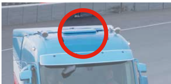
SPX 1200 RT SUPER COMPACT

Een standairco - of parking cooler - koelt de cabine voor de veiligheid en het comfort van de chauffeur tijdens rustperiodes, wanneer een truck geparkeerd staat. De standairco is aangesloten op de accu van de truck en werkt via een elektrische compressor als de motor is uitgeschakeld.