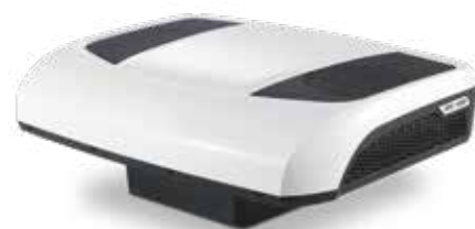
RTX 1000 RT